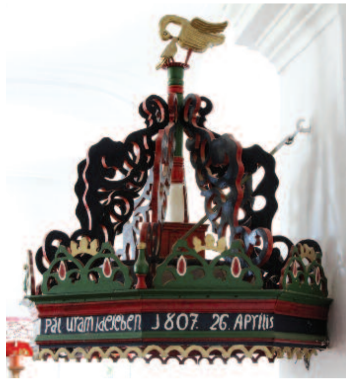
Az udvarfalvi templom szószékkoronája

A református egyházépítészeti értékes csoportját képezik a falusi református templomok, melyek berendezésében a parasztemberek művészi törekvéseiket valósították meg. A nagyrészt saját költségen épített és berendezett templomokat a nép magáénak érezte. Ezek voltak a falu ünnepeinek helyszínei, ahol a legszebb tárgyak kerültek elhelyezésre. Ráadásul a presztízsért és rangért folytatott versengésben is szerepet kaptak: a templomok és berendezésük a települések, egyházközségek büszkeségeivé, képviselőivé váltak. Ezekben a templomokban iparművészeti tárgyak mellett népművészeti alkotások és népi díszítések is láthatók, melyek az előbbiekhöz viszonyítva sokkal változatosabbak és sokrétűbbek. Bár a kettő kapcsolatban van egymással, sok közöttük a különbség is: az iparművészeti tárgyakat kézművesek, tanult mesterek állították elő a társadalom különböző rétegei számára, a népművészeti tárgyak létrehozatalában pedig maga a helyi közösség is részt vett. Ilyenek például a különböző templomi textíliák, az ácsolt ládák vagy egyéb berendezési tárgyak. Ugyanakkor városi mesterek, kisiparosok is alkottak a templomok számára (pl. festett bútorkok, kerámiák), illetve népi használatba