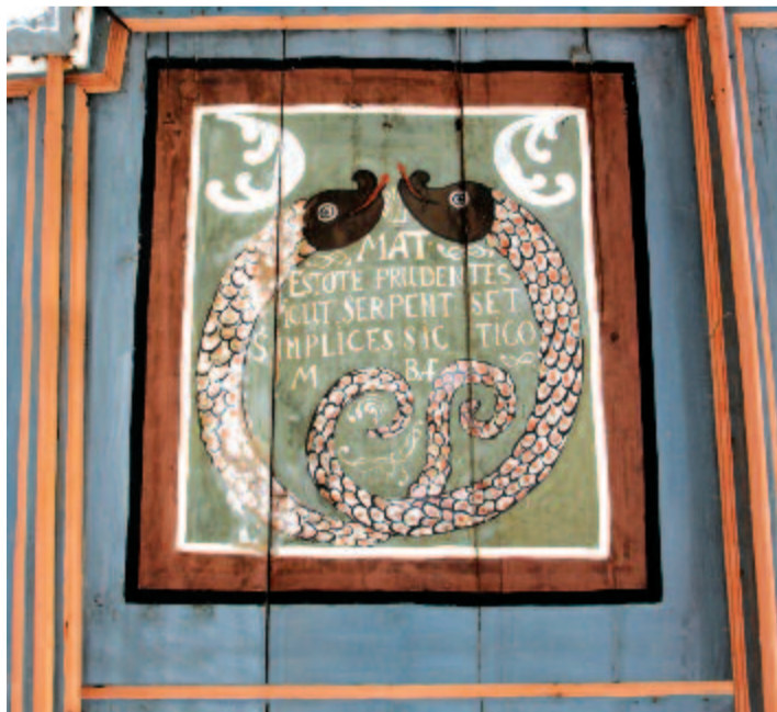
Maroscspói festett kazetta