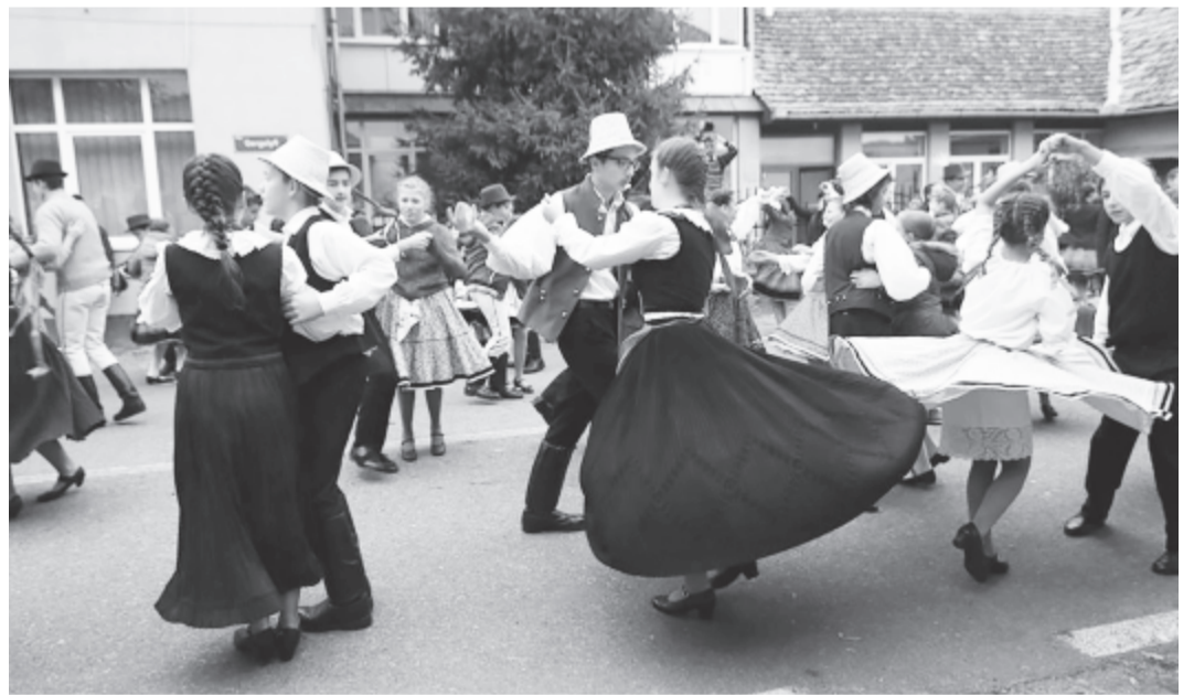
A kibédi kultúrház kicsinek bizonyult, így az utcán is táncoltak a fiatalok

Szombat délután szűknek bizonyult az amúgy tágas és szépen felújított művelődési otthon, a színpadon helyi, erdőcsinádi, gyulakutai, disznajói, marosvásárhelyi, balavásári, sóváradai, marosfelfalusi, vajdaszentiványi, szabédi, erdőszentgyörgyi, backamadarasi, nyáradszeredai, mezőbándi és marosludasi csoportok váltották egymást, de a nézőtérén sem akadt sok üres hely.