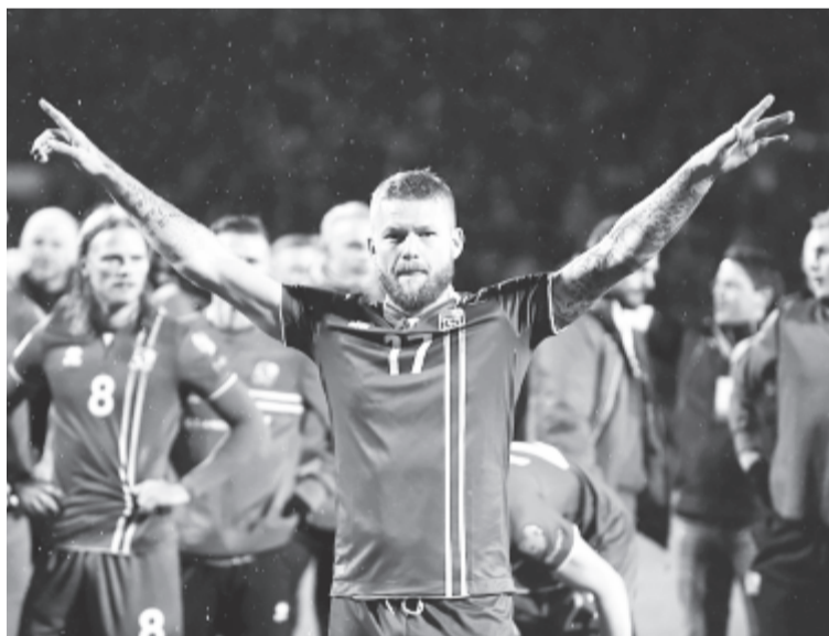
A 300 ezer lakossal rendelkező Izland is kint lesz a világbajnokságon

Az európai térségből Szerbia és Izland labdarúgó-válogatottja jutott ki hétfőn a jövő évi oroszországi világbajnokságra, amelyen így már 17 együttes részvétele biztos.